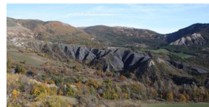
Relief chahuté et affleurement de marnes (Tartonne)