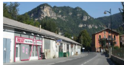
Entrées de ville, zones artisanales et commerciales à améliorer (Annot)