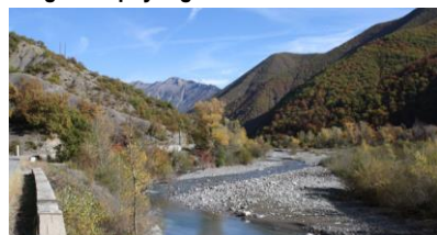
Rivières "en tresse" avec bancs de galets et belles ripisylves (Le Bes - La Robine sur Galabre)