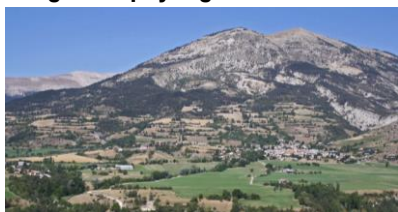
Bocage de prairies et céréales (Thorame)