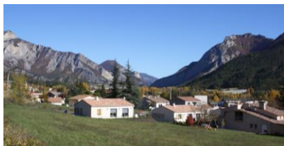
Extensions urbaines pavillonnaires (La Motte-du-Caire)