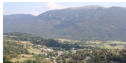
Progression de la forêt (Soleilhas)