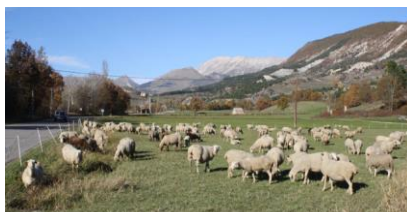
Prairies d'élevage (Clumanc)