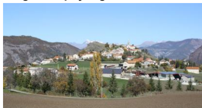
Silhouette de village perché concurrencée par des constructions récentes (Turriers)